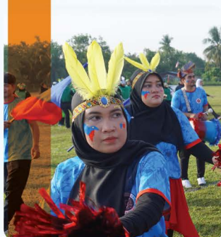
Hari Warga Staf USM 2025