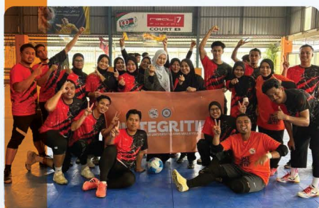
SUKJAP Kampus Kesihatan 2025