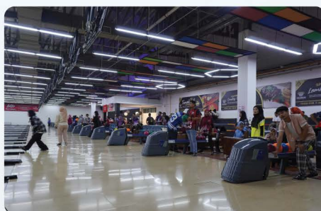
Tenpin Boling UPKA 2025