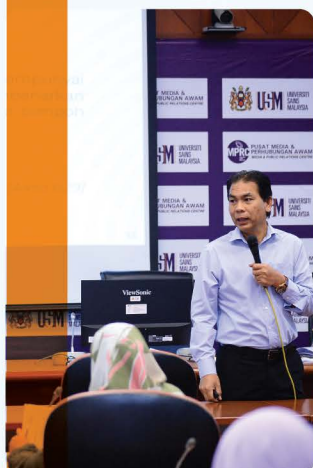
Bengkel Jadual Pelupusan Rekod Fungsian HPUSM Bersama Arkib Negara Malaysia