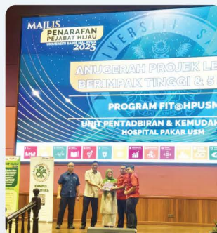
Anugerah Projek Lestari Berimpak Tinggi & 5 Daun