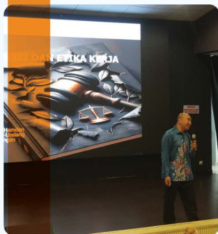
Town Hall Integriti dan Etika: Menjaga Standard Tinggi Dalam Perkhidmatan