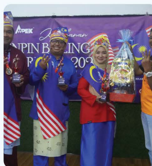
Kejohanan Tenpin Bowling Ambang Merdeka