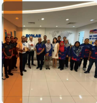
Lawatan Penanda Aras Perkhidmatan Dobi ke Pusat Pengurusan Linen