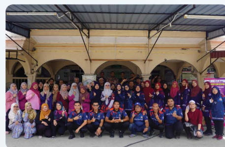
Program KRIS @ Kg. Sg Sok