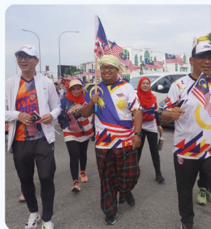
Brisk Walk Merdeka