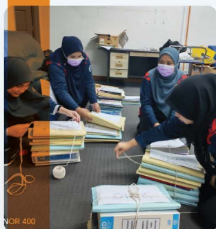
Gotong-royong Pengurusan Fail UPKA