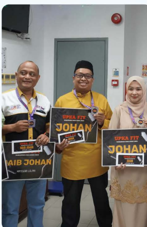
Fit Ramadhan Challenge UPKA