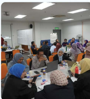
Bengkel Perancangan Strategik KPI 2025